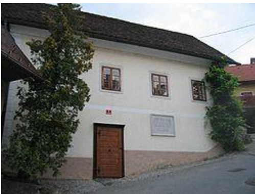
Slika 2 Cankarjeva spominska hiša

Uvrščamo ga med štiri predstavnike slovenske moderne (poleg Murna, Ketteja in Župančiča). Letnica 1899 je letnica izida njegove prve pesniške zbirke Erotika in Župančičeve Čaše opojnosti in velja za začetek slovenske moderne. V svoji pesniški zbirki je zbral mladostne ljubezenske pesmi,