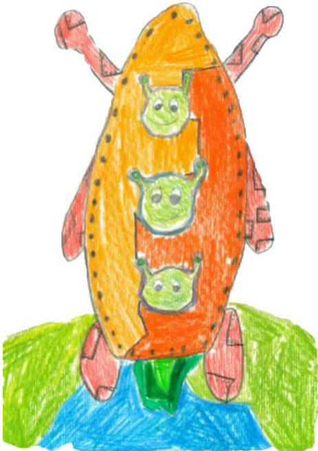
Nuša Vrabc, 6.a Drejček in trije marsovčki mentorica: Gordana Štucin